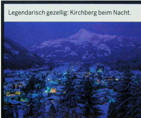
Legendarisch gezellig: Kirchberg beim Nacht.