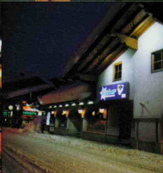
Après-skiën kun je hier als de beste. Alle Nederlanders verzamelen zich in de Eisbar, supergemütlich!