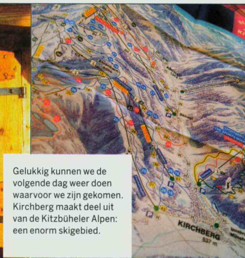
Gelukkig kunnen we de volgende dag weer doen waarvoor we zijn gekomen. Kirchberg maakt deel uit van de Kitzbüheler Alpen: een enorm skigebied.