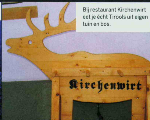
Bij restaurant Kirchenwirt eet je écht Tirols uit eigen tuin en bos.